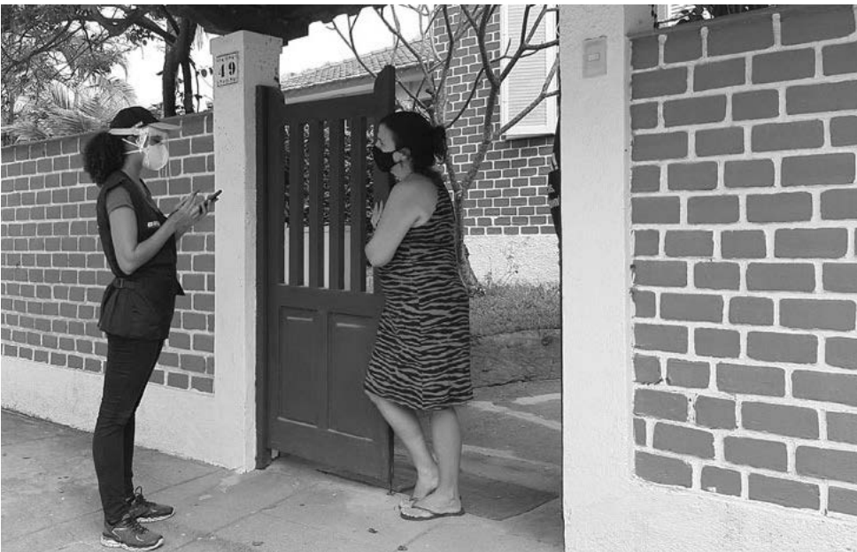
Ao todo, são 274 vagas disponíveis, distribuídas entre os 13 municípios que abrangem a agência do IBGE de Pato Branco

O valor da taxa de inscrição é de R$ 57,50; podendo também ser solicitada isenção por àqueles que